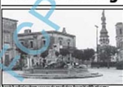
La piazza principale di Verole, sede di una manifestazione...