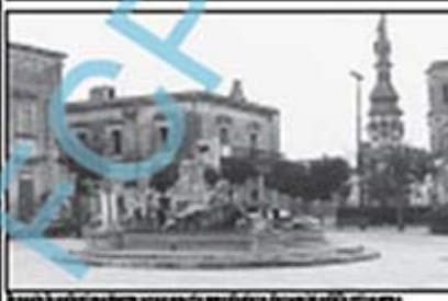
Il nuovo Pug, la piazza di Verole, è stata inaugurata con una cerimonia solenne.